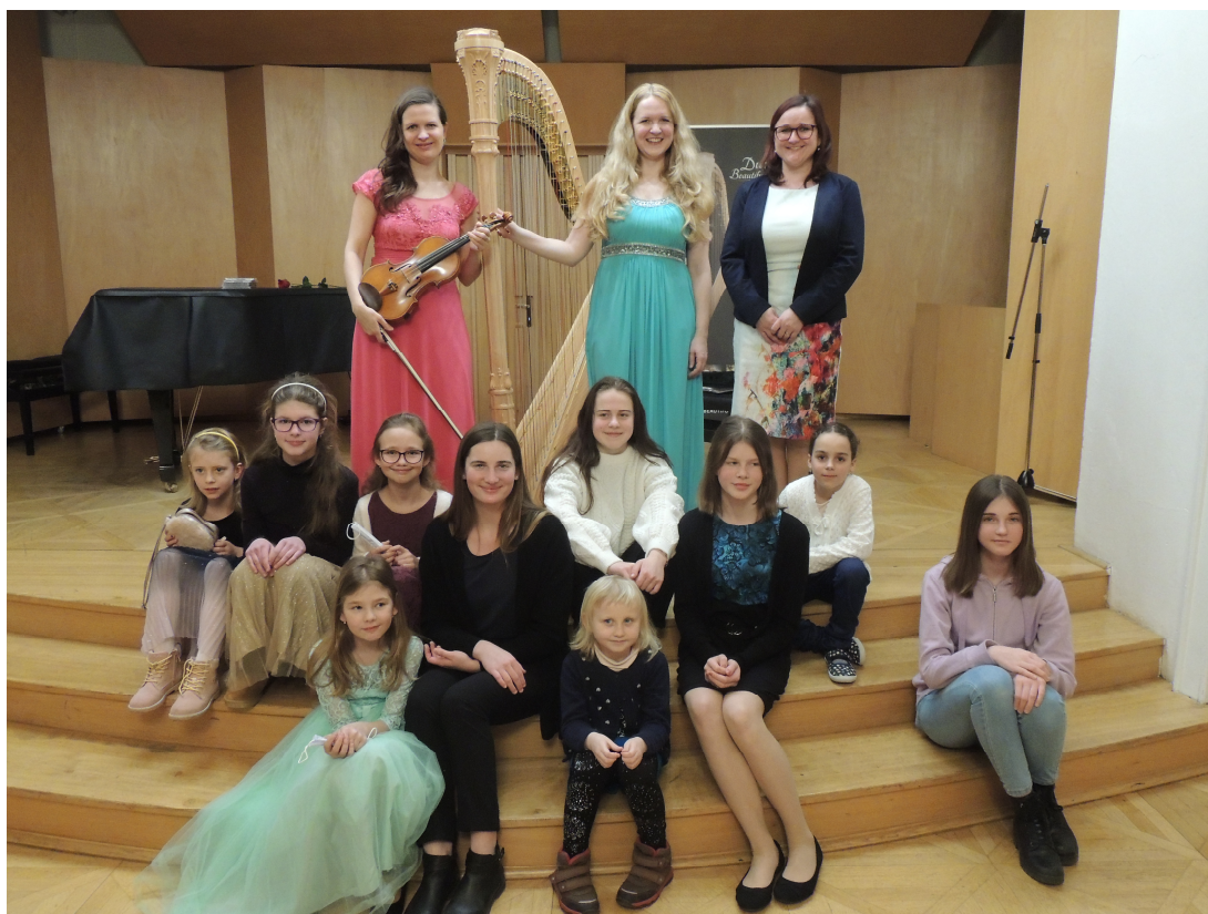
Koncert a workshop Dua Beautiful Strings, 21. 2. 2022