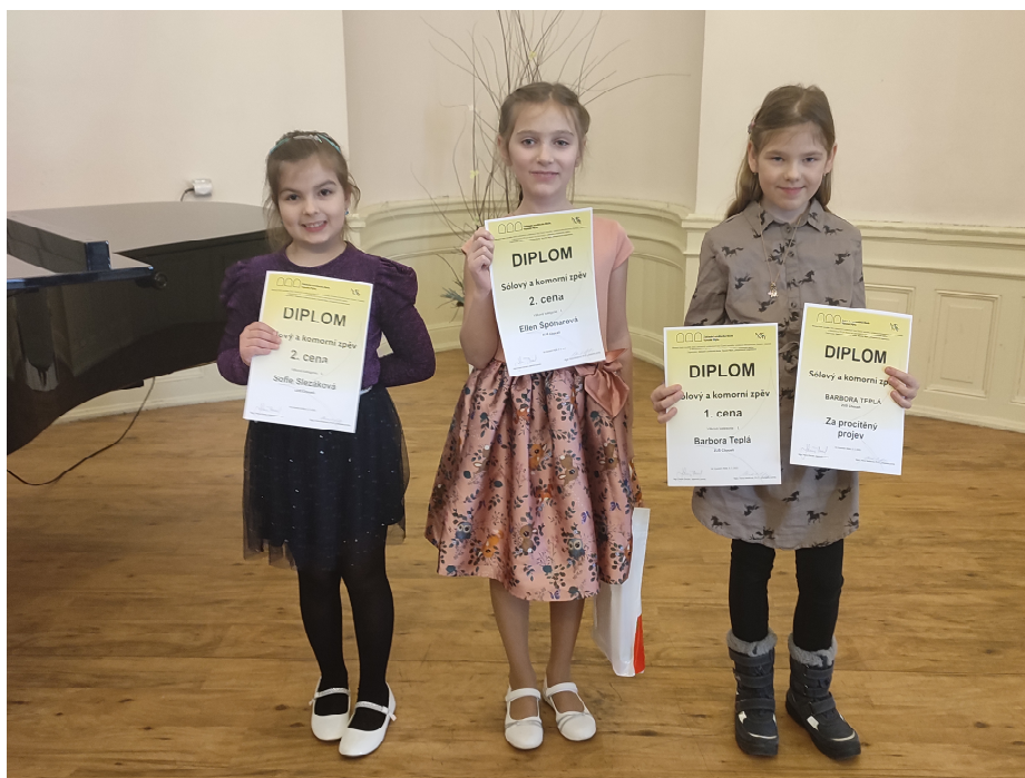
Okresní kolo soutěže ve zpěvu, ZUŠ Vysoké Mýto, 9. 3. 2022