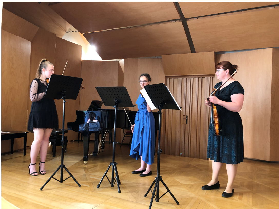
Absolvenstký koncert, sál ZUŠ Choceň, 6. 6. 2022