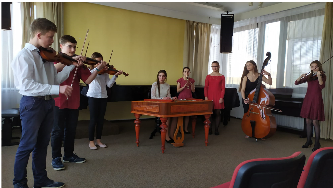
Krajské kolo soutěže ve hře na cimbál, ZUŠ Pardubice, 12. 4. 2022