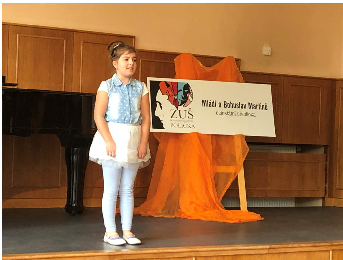
Pěvecká soutěž Mládí a Bohuslav Martinů, ZUŠ Polička, 26. 4. 2022