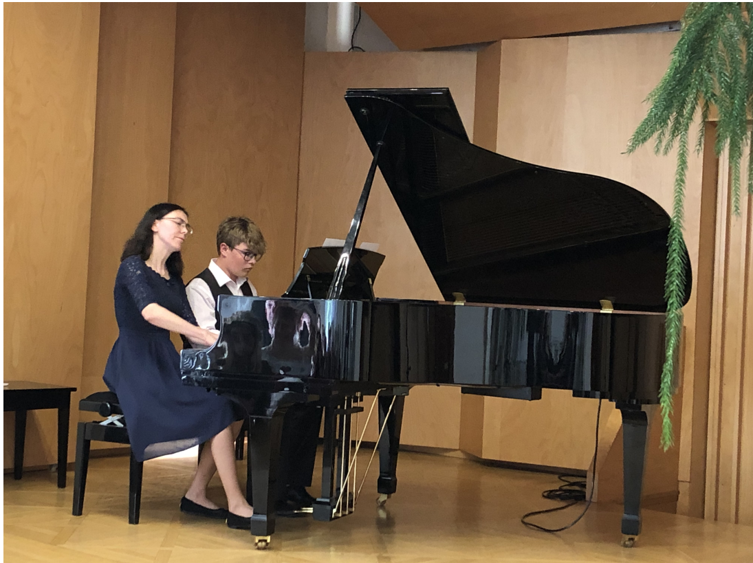
Absolvenstký koncert, sál ZUŠ Choceň, 23. 5. 2022