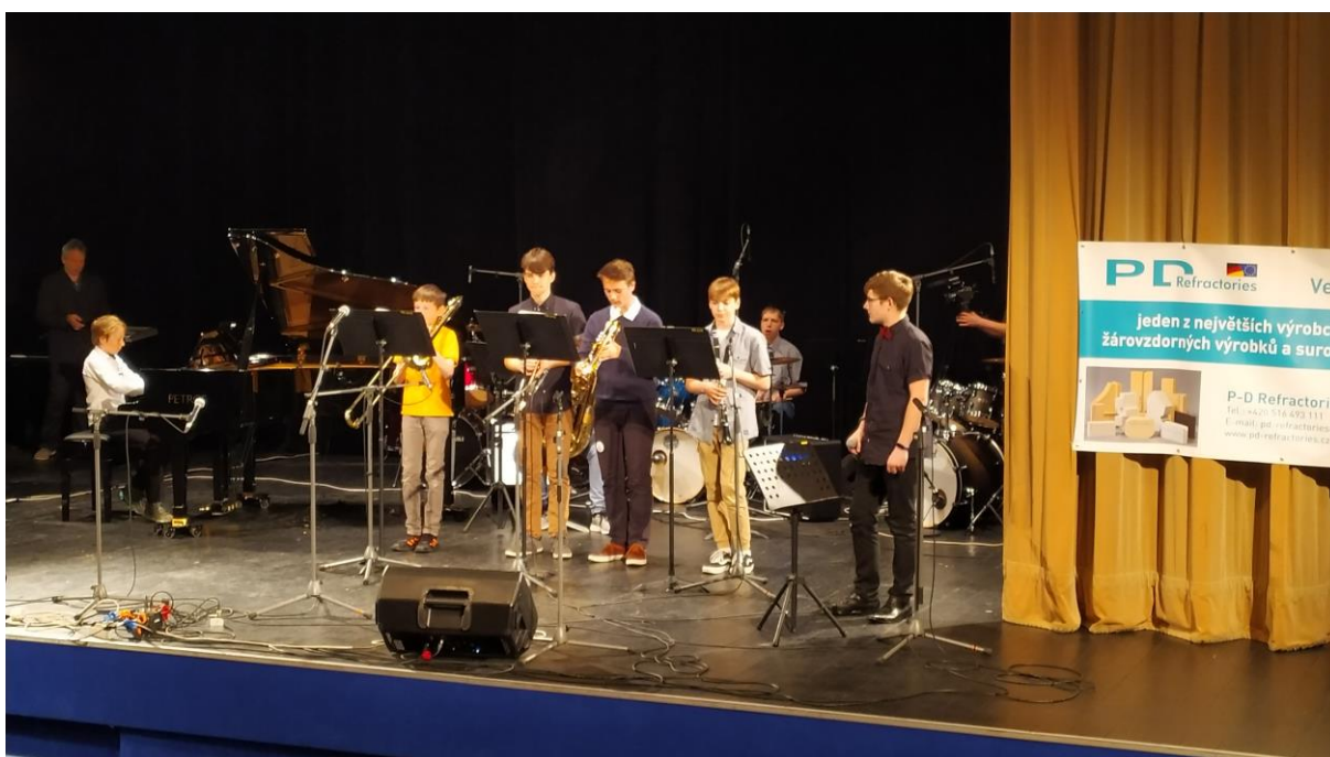
Svitavské kmoření, ZUŠ Svitavy, 11. 5. 2023