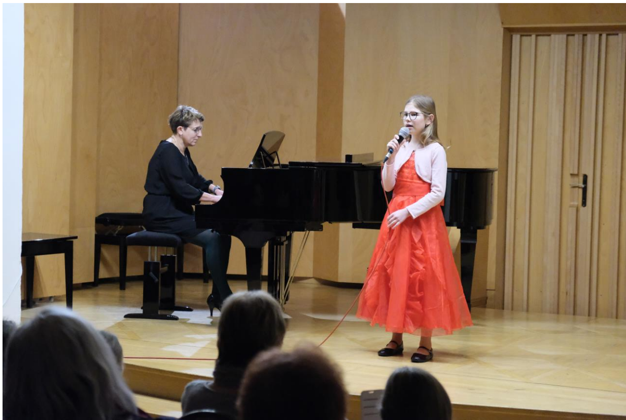
Pololetní koncert, sál ZUŠ Choceň, 23. 1. 2023