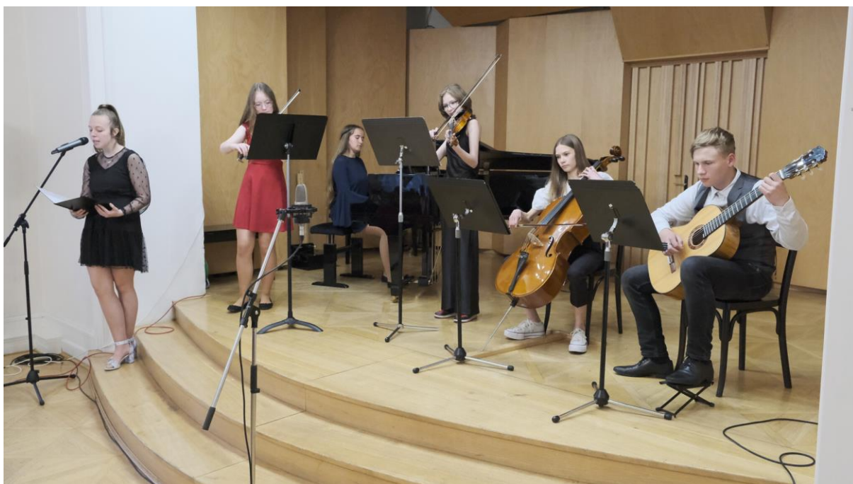
Absolventský koncert, sál ZUŠ, 16. 5. 2023