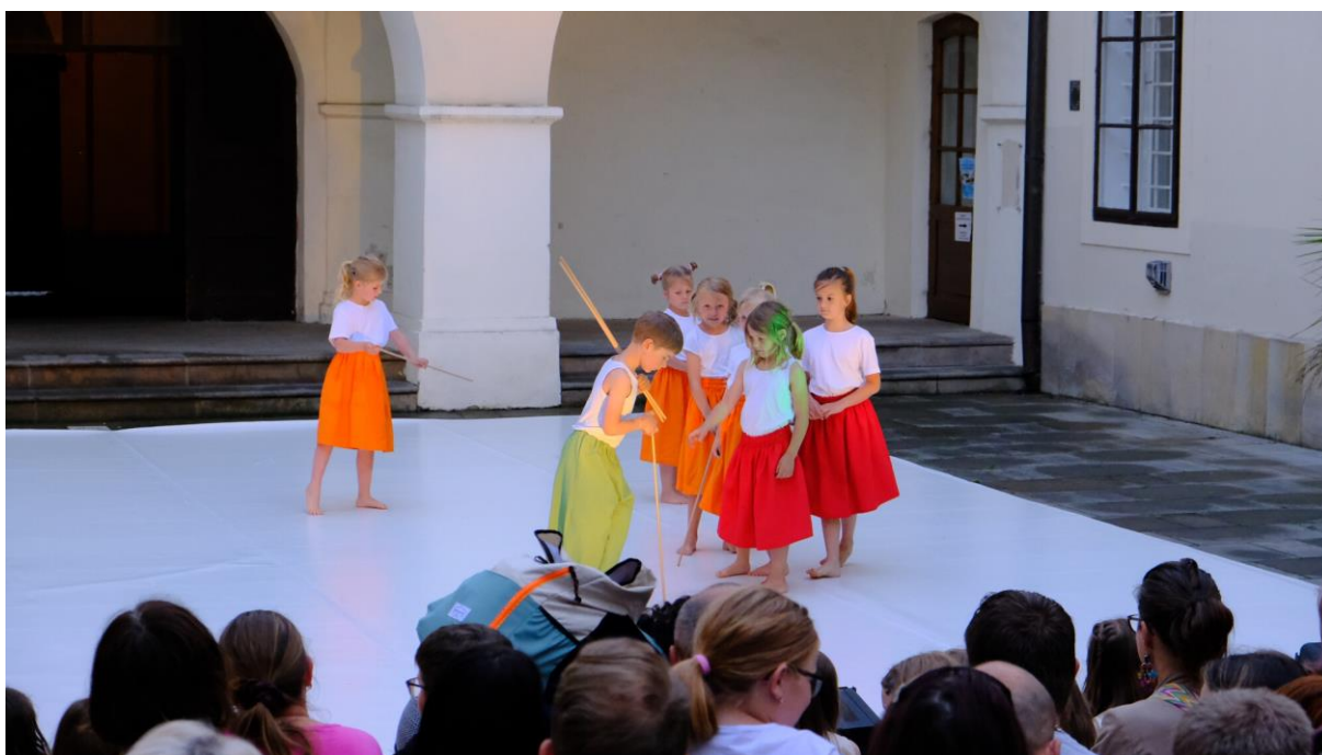
Skorofestival tance, nádvoří zámku, 8. 6. 2023