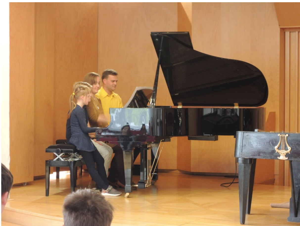
Koncert hudebních rodin, sál ZUŠ, 15. 4. 2023