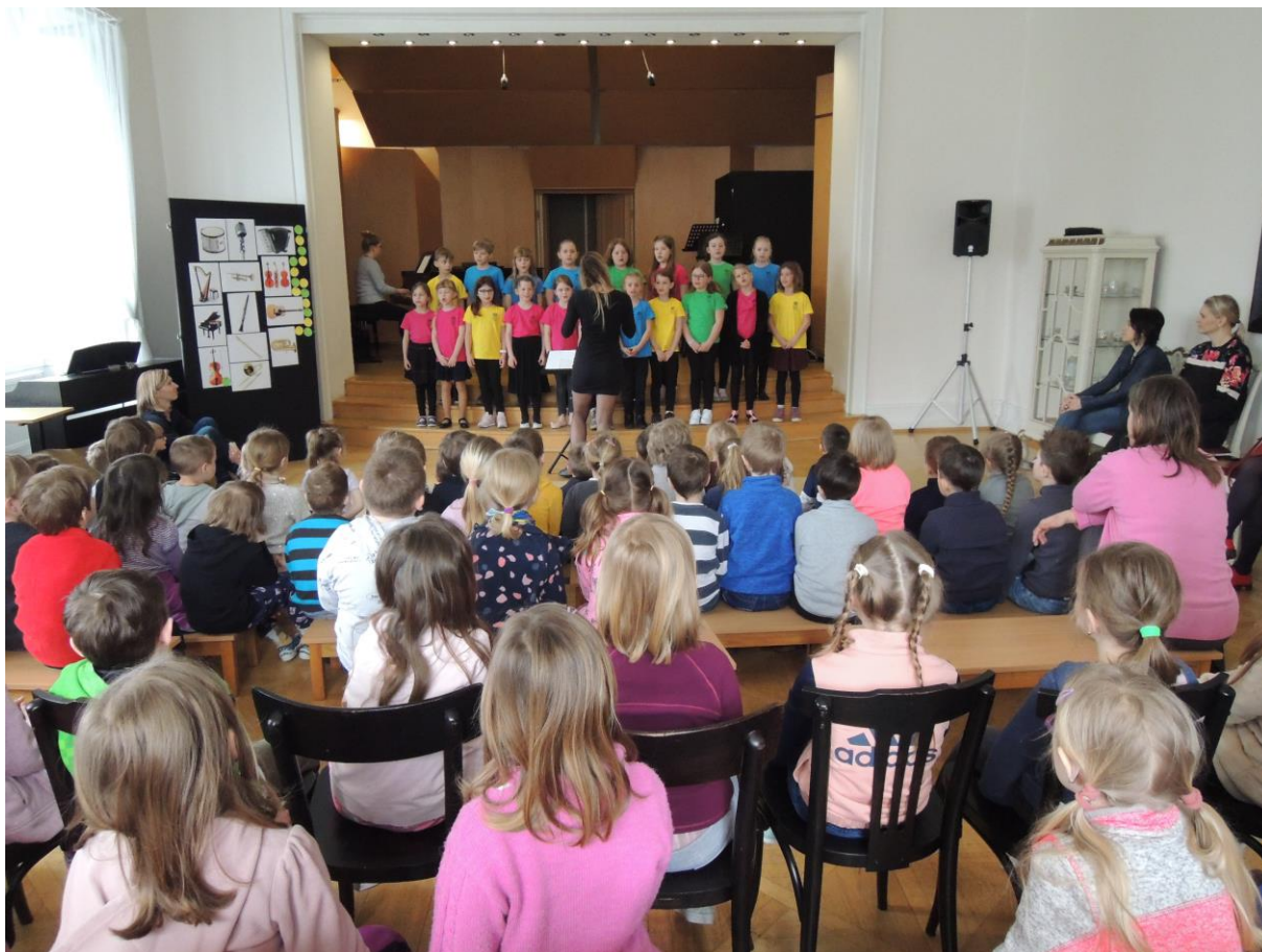
Koncert pro MŠ, sál ZUŠ, 19. 4. 2023