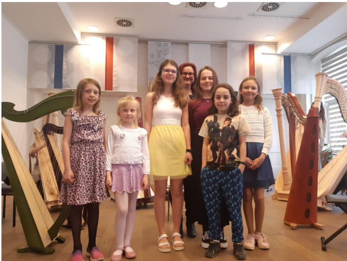
Prah-a-harp, Praha, 5. 6. 2023