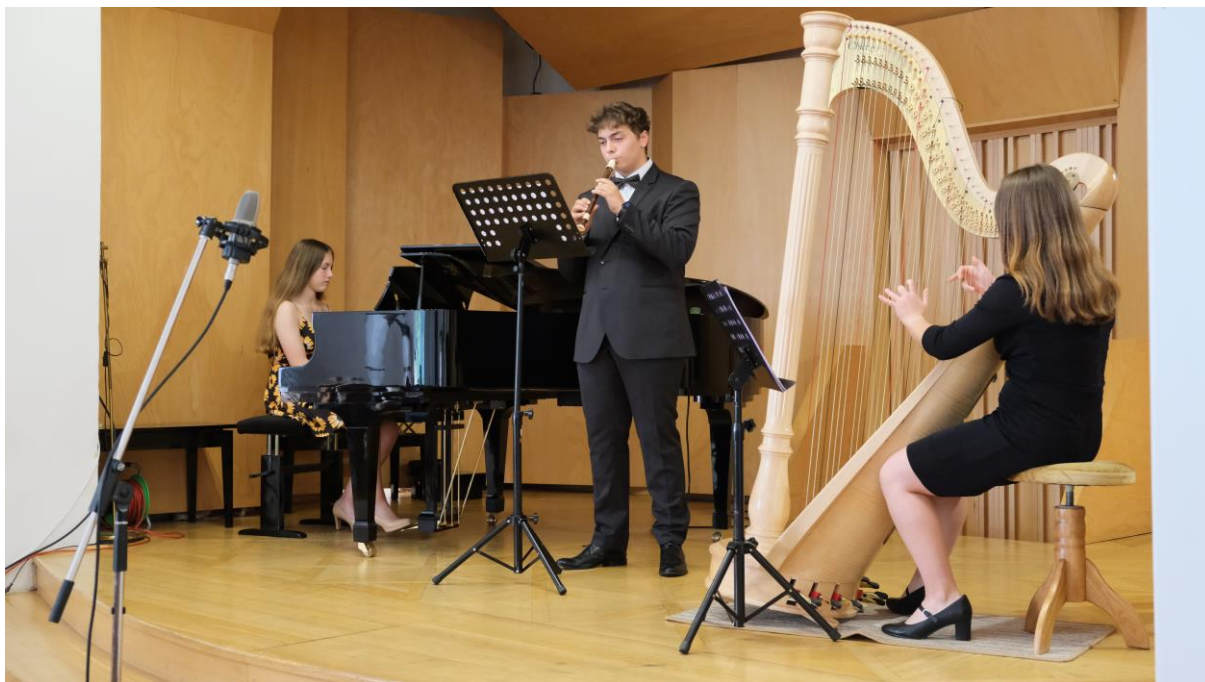
Závěrečný koncert, sál ZUŠ Choceň, 12. 6. 2023